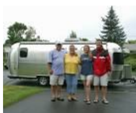
6. hace fresco